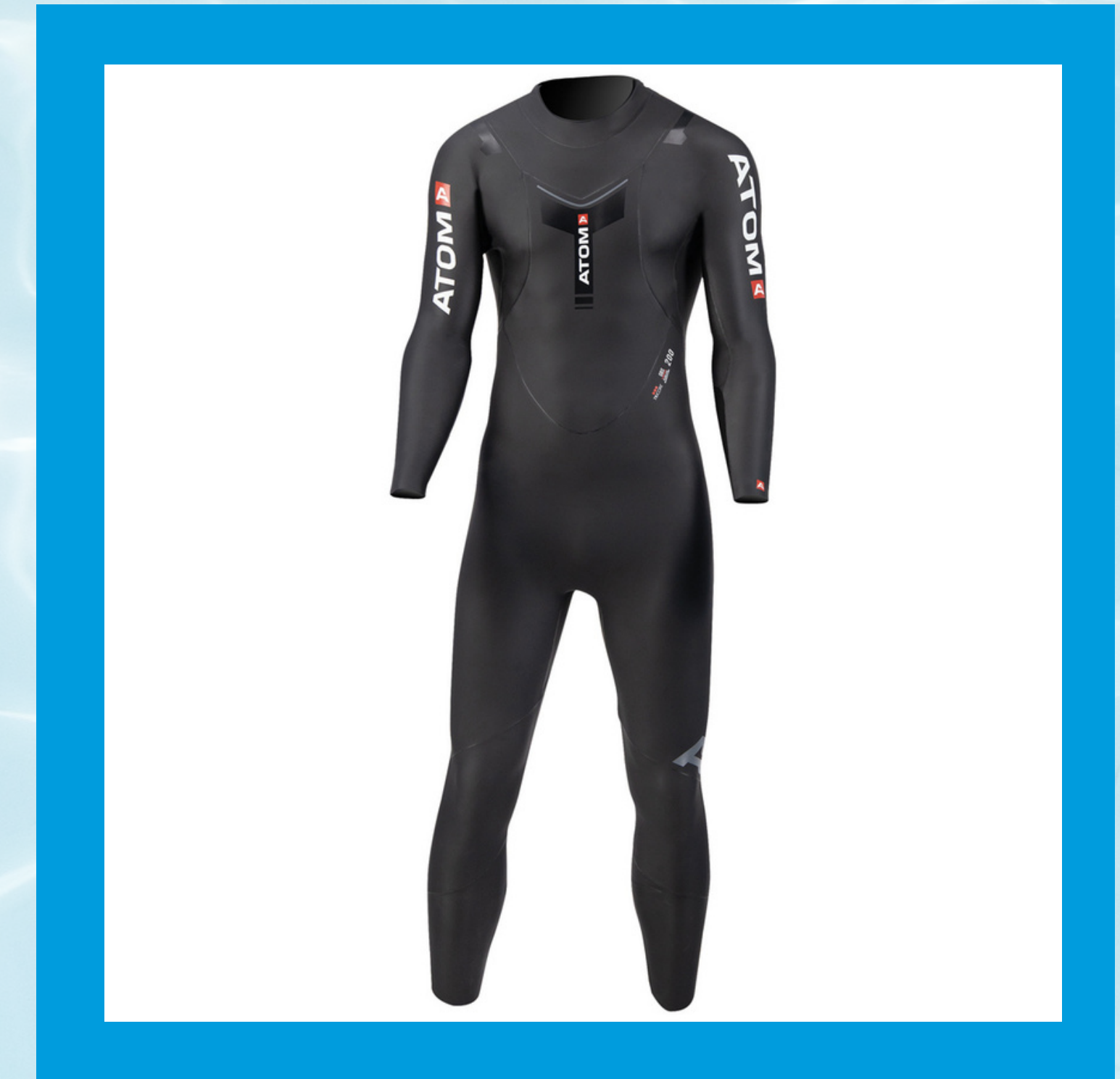
Atom 200 Pro