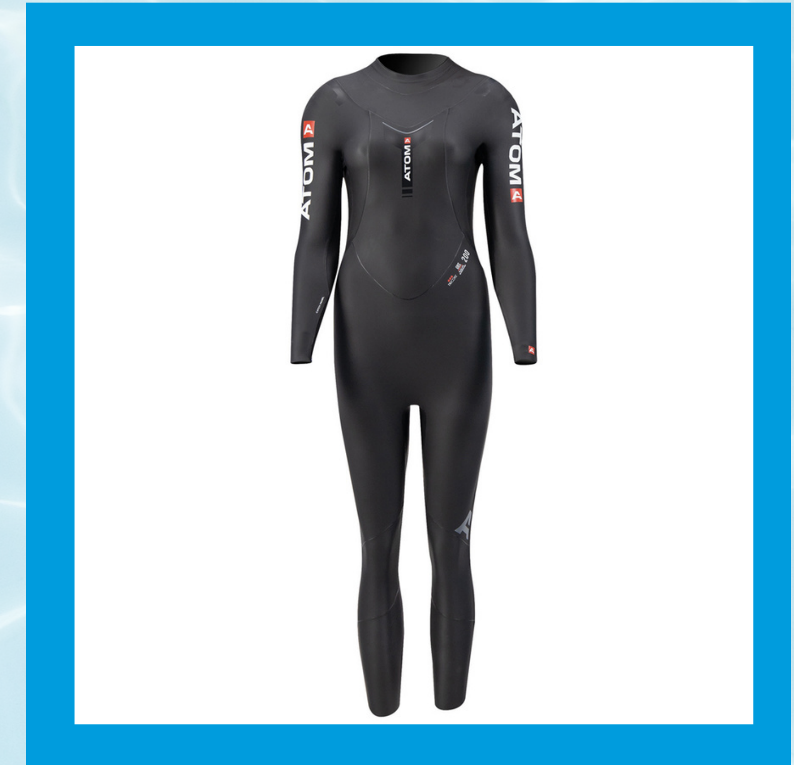
Atom 200 Pro