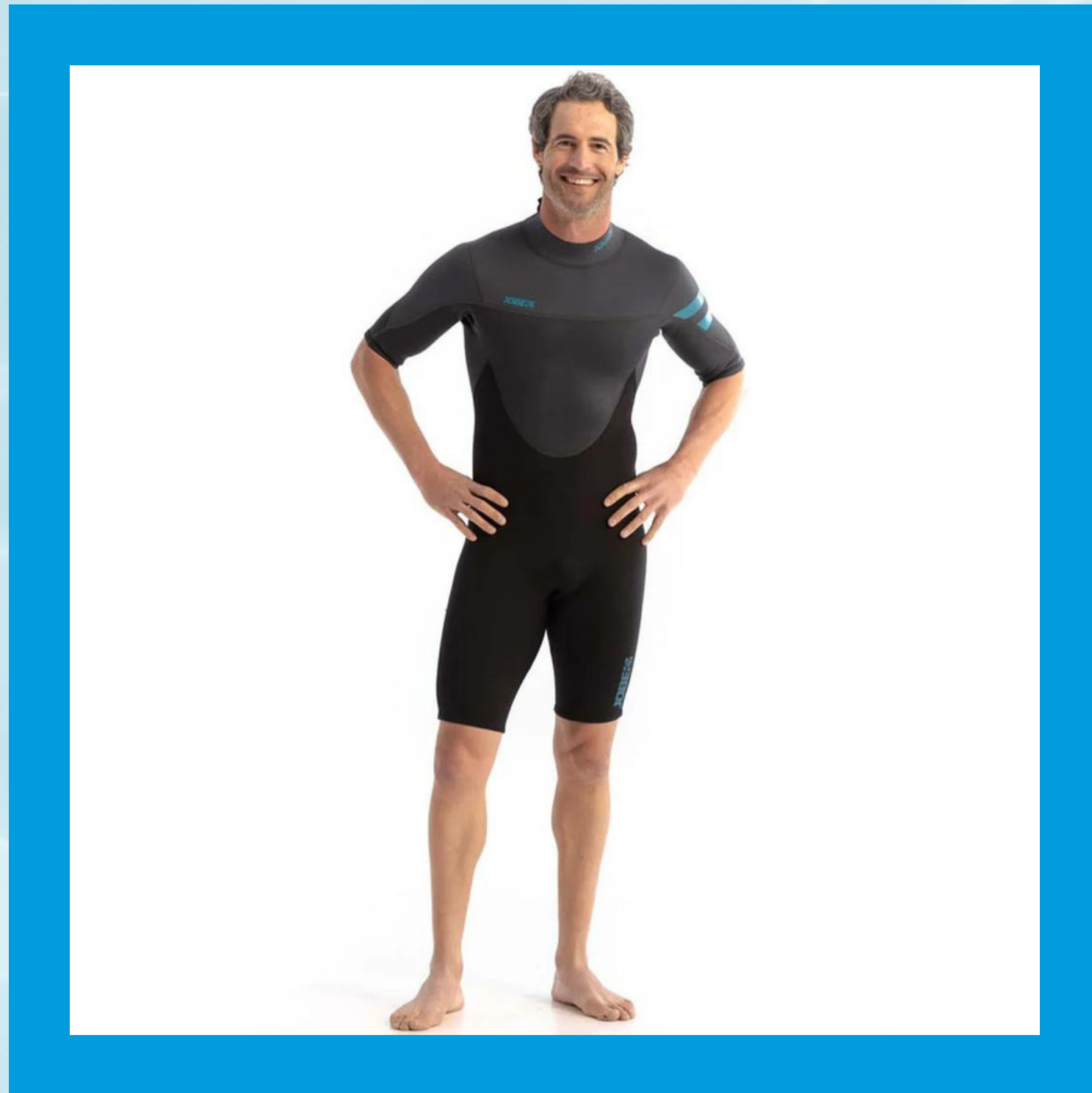
Perth Shorty 3/2 mm