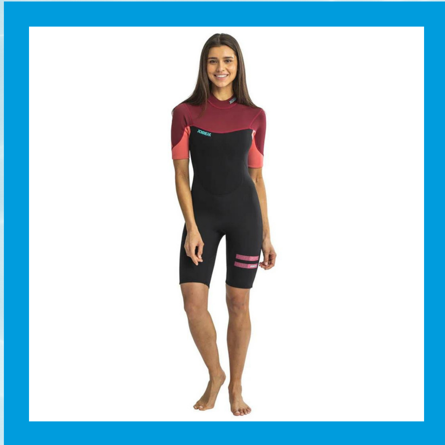
Sofia Shorty 3/2 mm