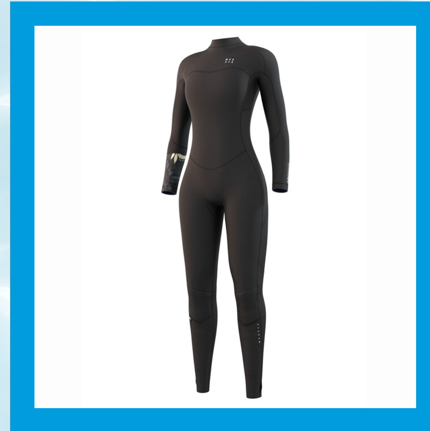
Dazzled Steamer 4/3 mm