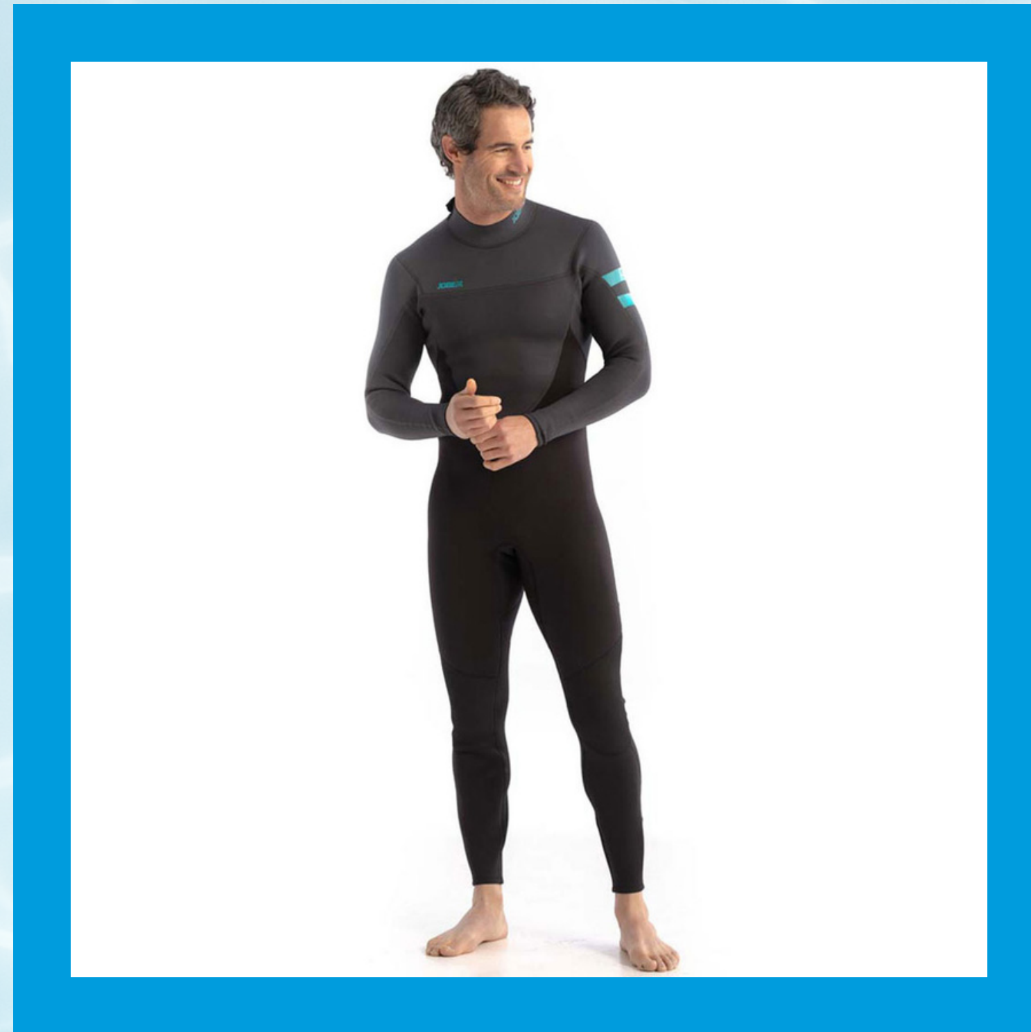
Perth Fullsuit 3/2 mm