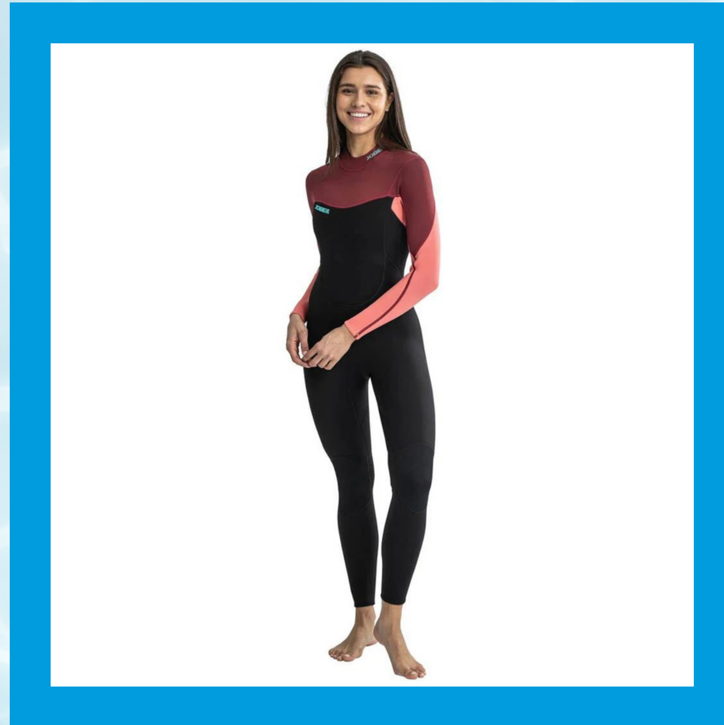
Sofia Fullsuit 3/2 mm